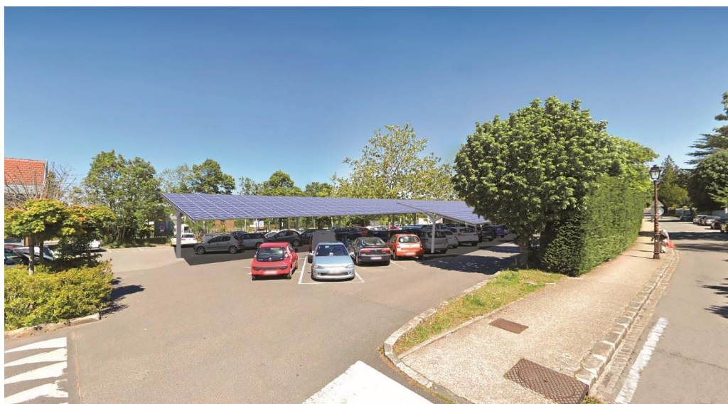
Futur parking de la gare de Louveciennes (Ile-de-France)